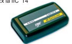
红外数据链接 USB 适配器